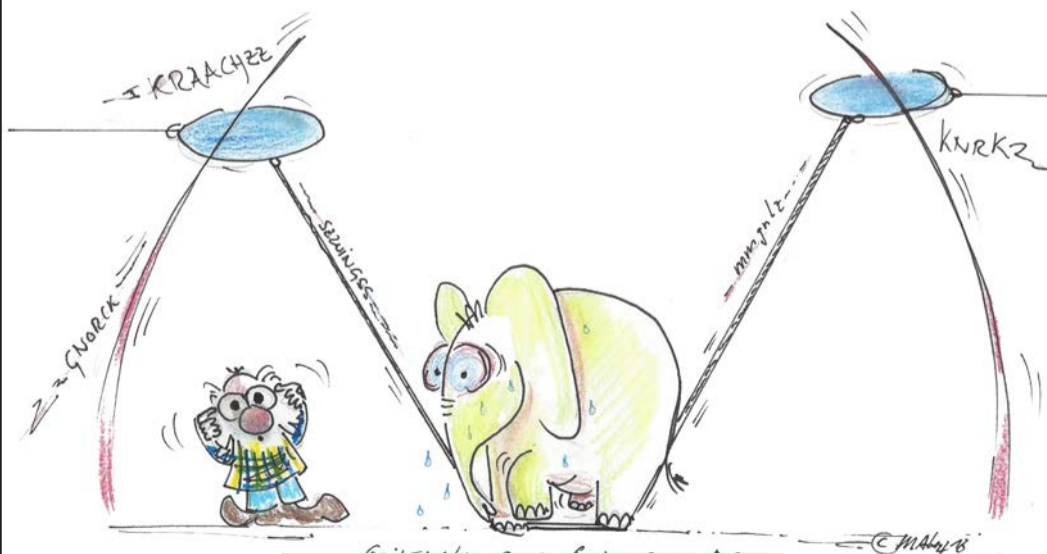
„SEILTANZ DER SCHWEREN ART“